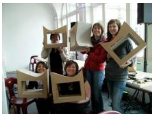
Création de mobilier en carton - Labelle 2010